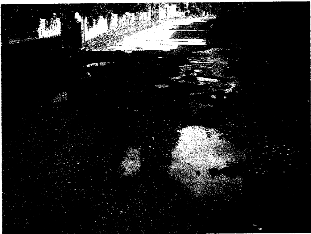
Rua dos Imigrantes – 02.01.2013