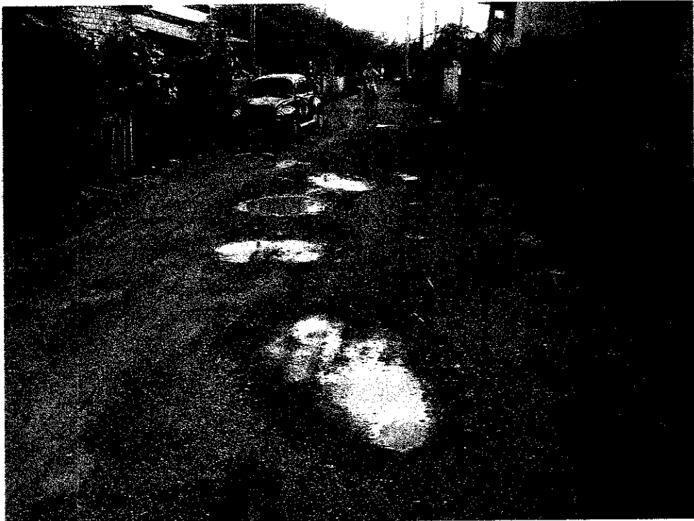
Rua dos Imigrantes – 02.01.2013