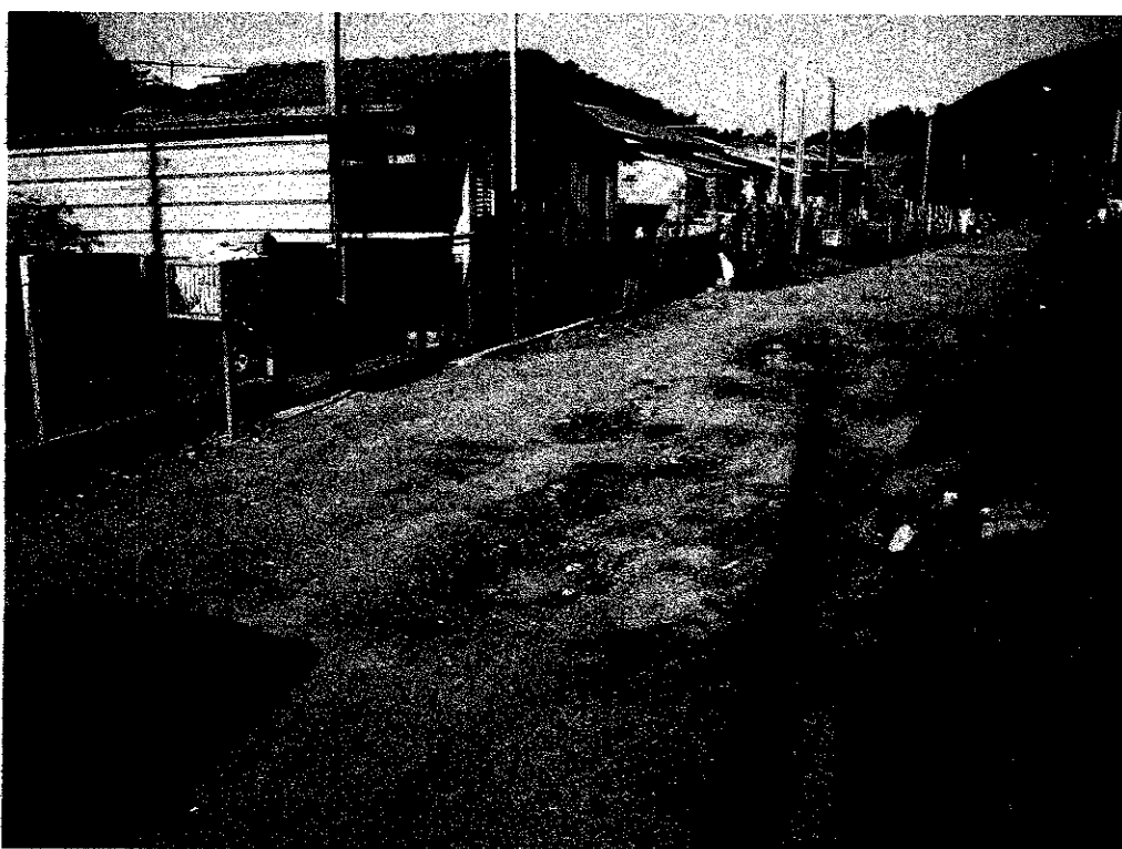
Rua dos Imigrantes – 02.01.2013