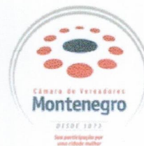
Imagem em anexo: