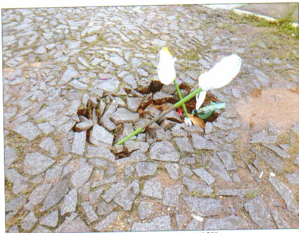
Rua Ponta Negra - em frente ao nº 280