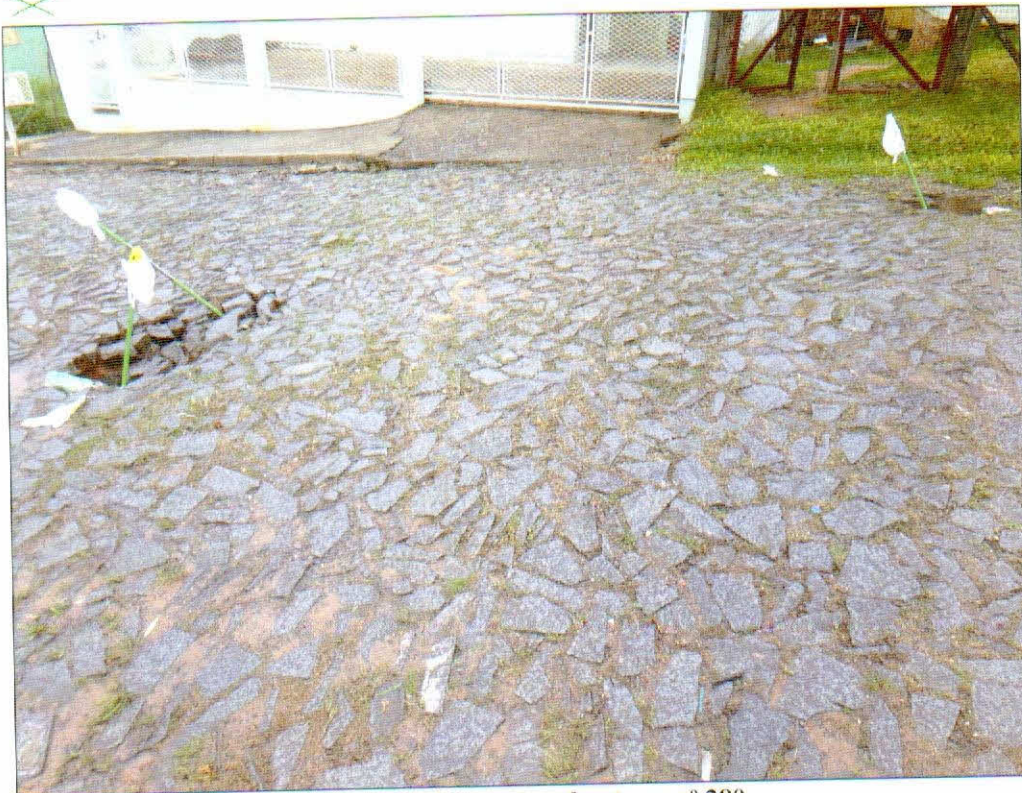
Rua Ponta Negra - em frente ao nº 280