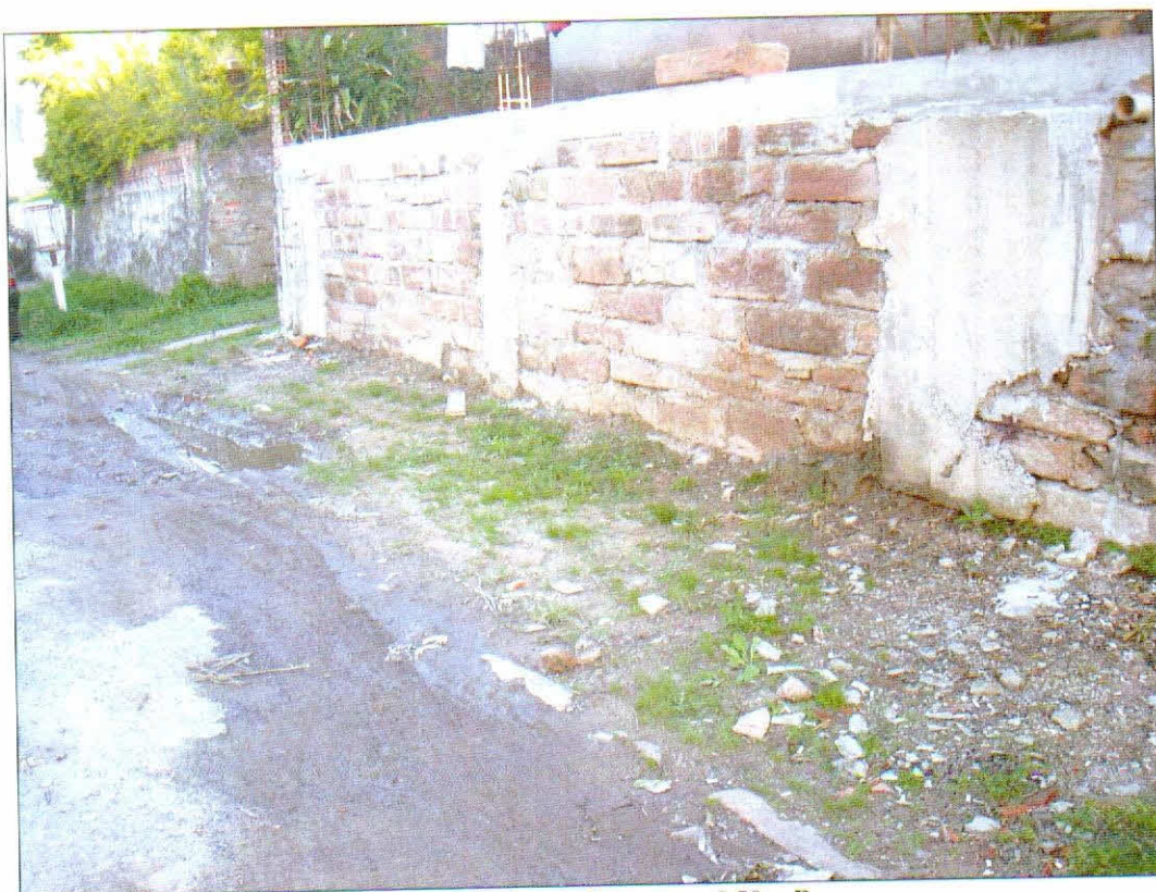
Rua Cap. Jacob Franzen, nº 50 - B