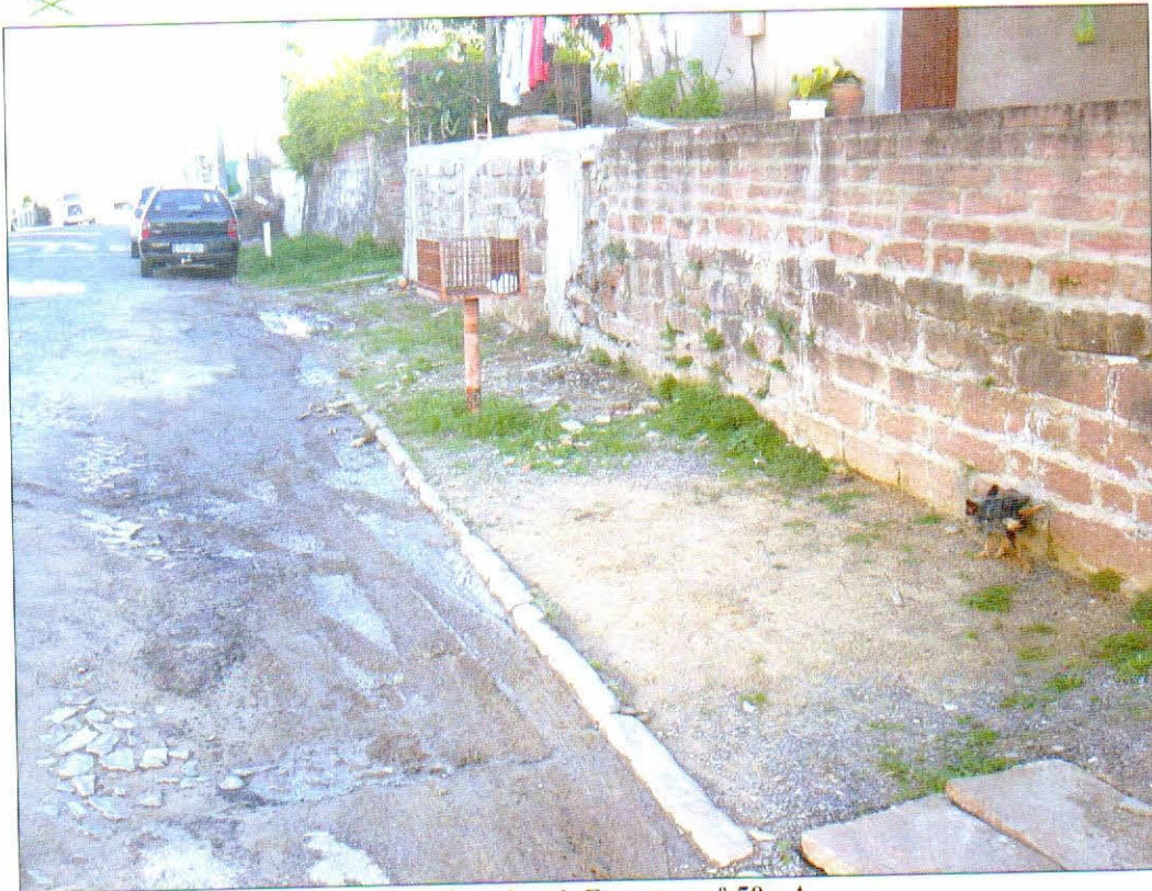
Rua Cap. Jacob Franzen, nº 50 - A