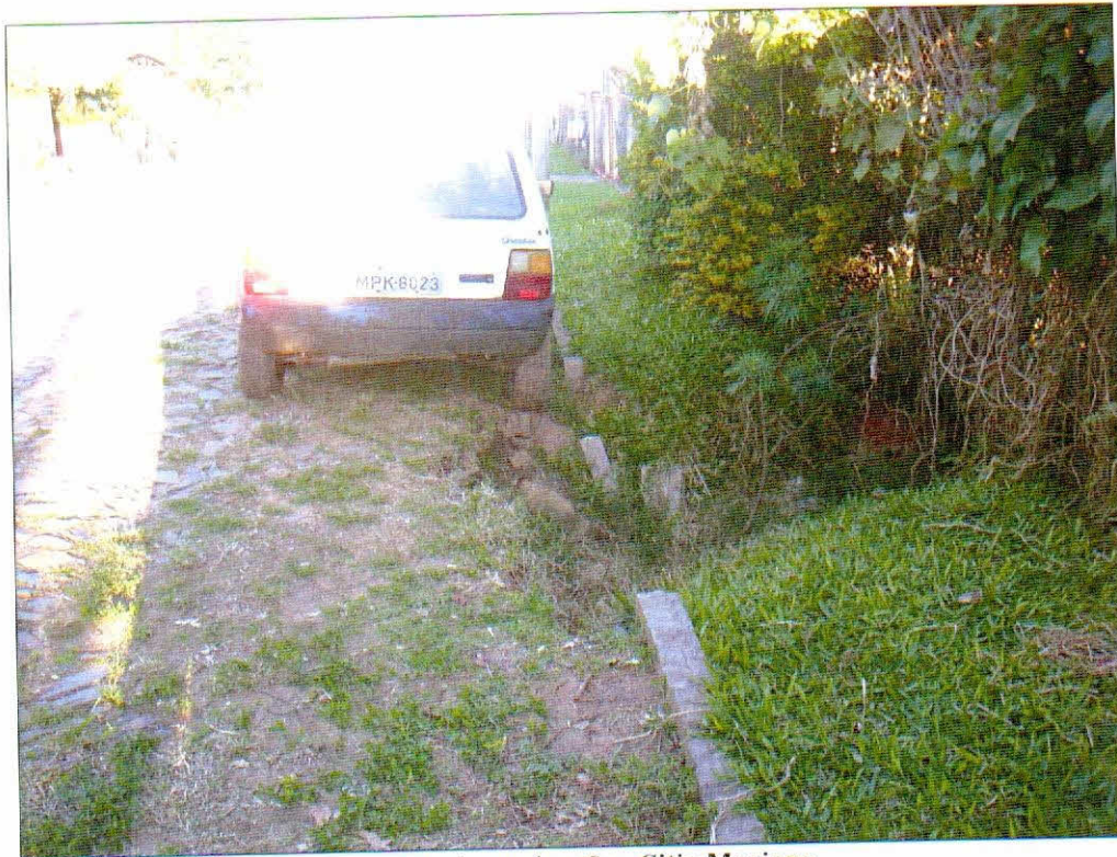
Rua sem denominação - Sitio Mariano