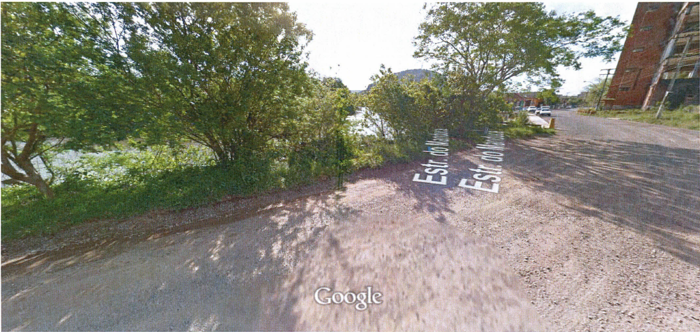
Captura da imagem: out 2011

Montenegro, Rio Grande do Sul Street View - out 2011