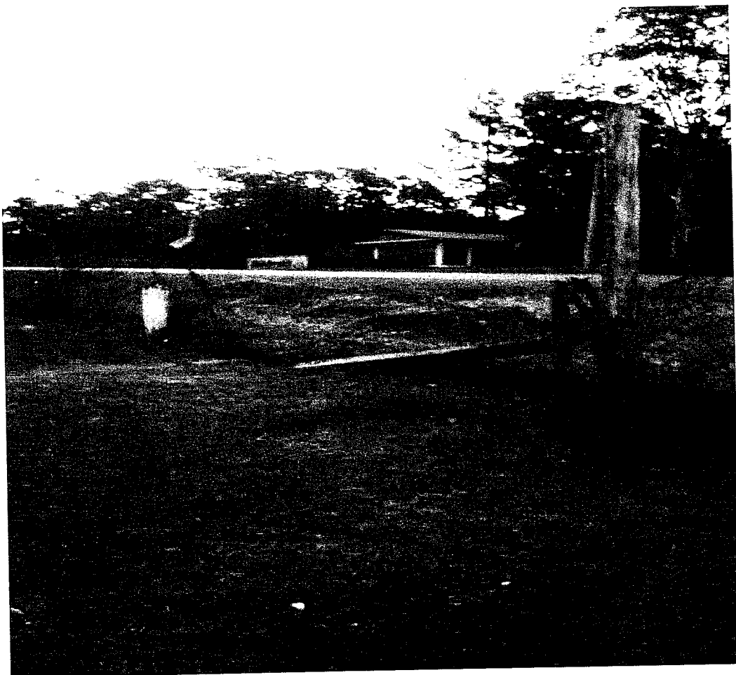
Parque Centenário Erny Carlos Heller – Cerca junto à RS 287 (15.06.2016)