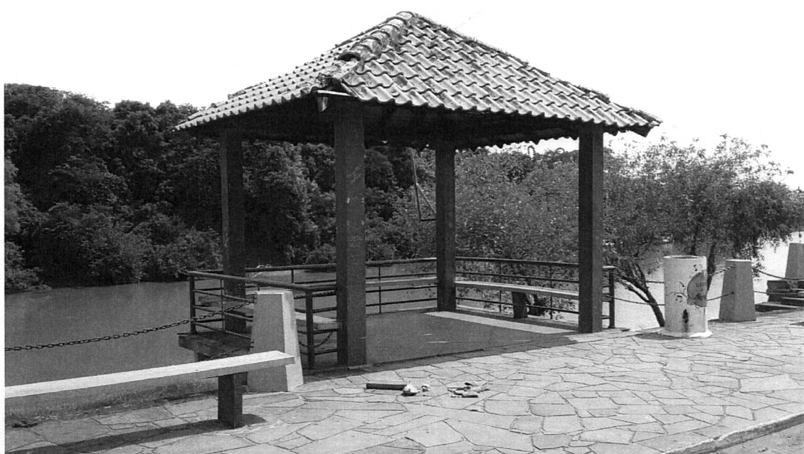
Quiosque localizado junto ao Cais do Rio Caí, em frente ao prédio do Legislativo.