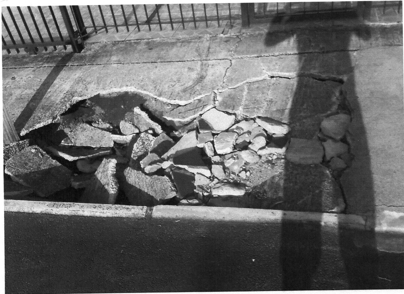
Rua Carlos Petry - Com o tanco das ferras (esquina) Exigido desmoronando