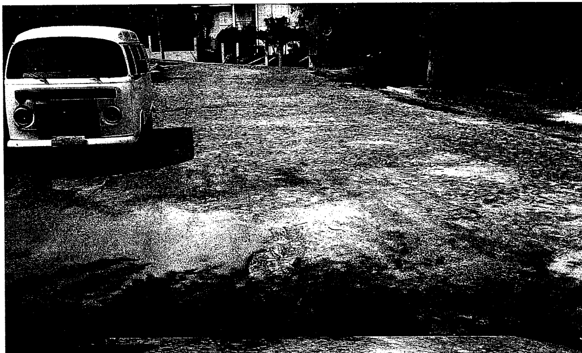
Rua Antônio Marques – B. Rui Barbosa (Em frente aos nrs. 520, 532)