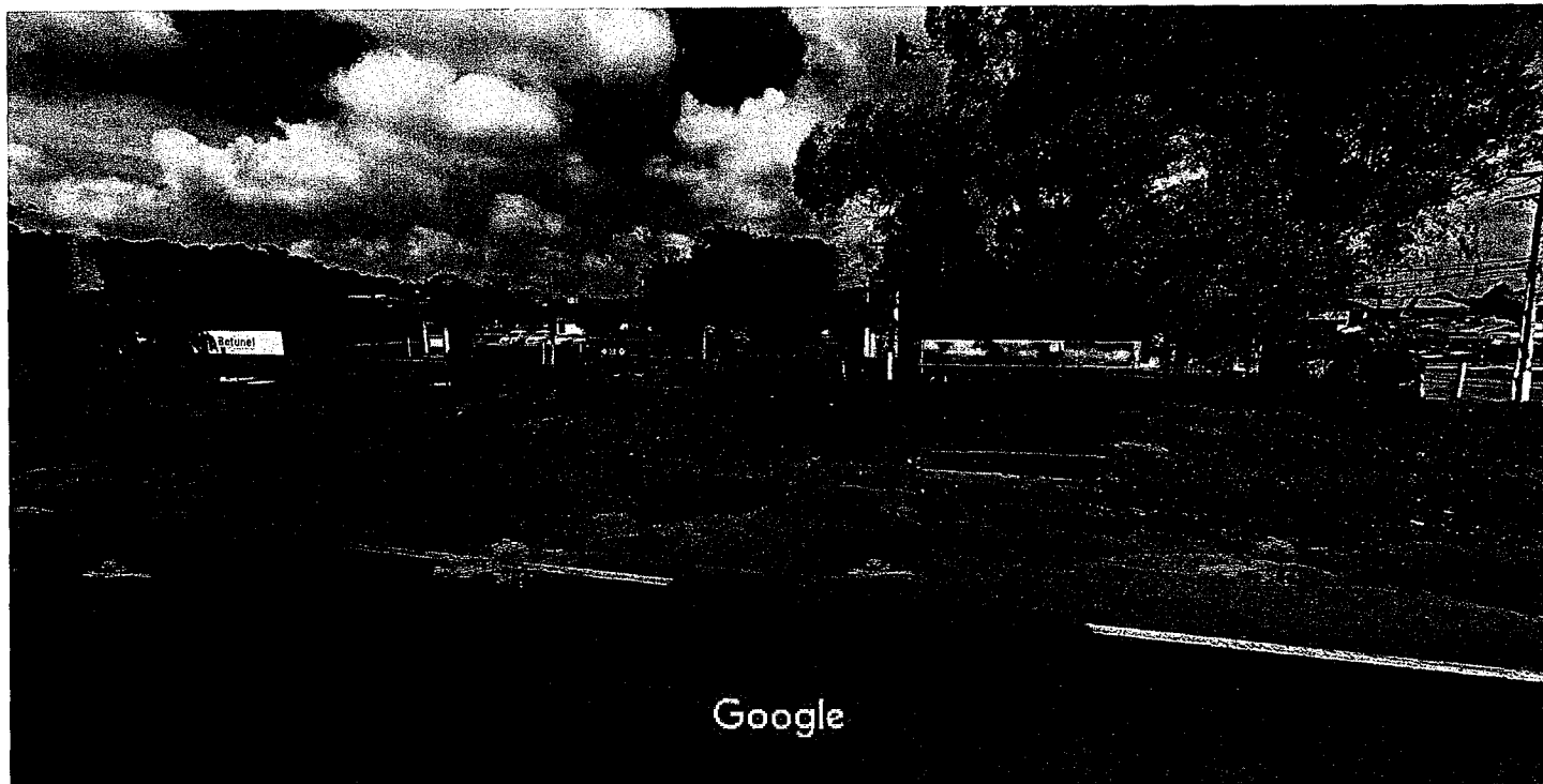
Captura da imagem: fev 2015