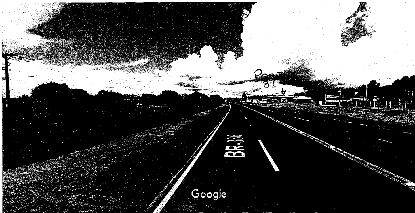
Captura da imagem: mar 2015