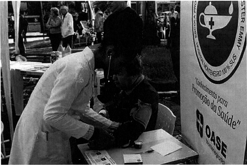
ALUNOS da Schwester Emmy participaram nesta semana da Feira de Saúde

Por Reinaldo Alnei Ew - 18/05/2017 às 00:00.