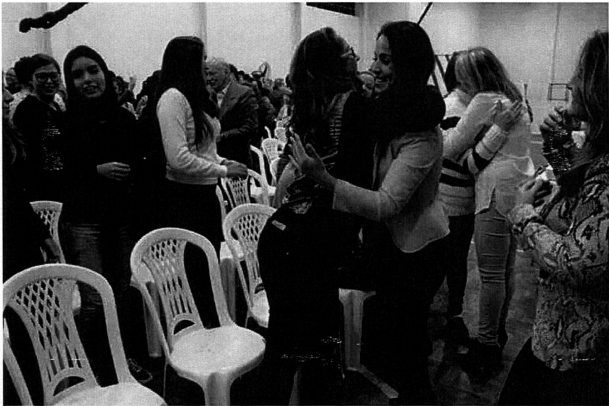
Abraco entre os convidados marcou a fraternidade da Escola

Por Reinaldo Alnei Ew - 19/05/2017 às 08:30.