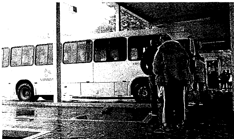
EM UMA das linhas, a redução de estudantes usando foi de até 34,21% em relação ao ano anterior

nas que tem como destino a Feevale, a redução foi maior, 34,21%, em comparação ao mesmo período do ano anterior. Somente um ônibus faz as linhas em cada turno.