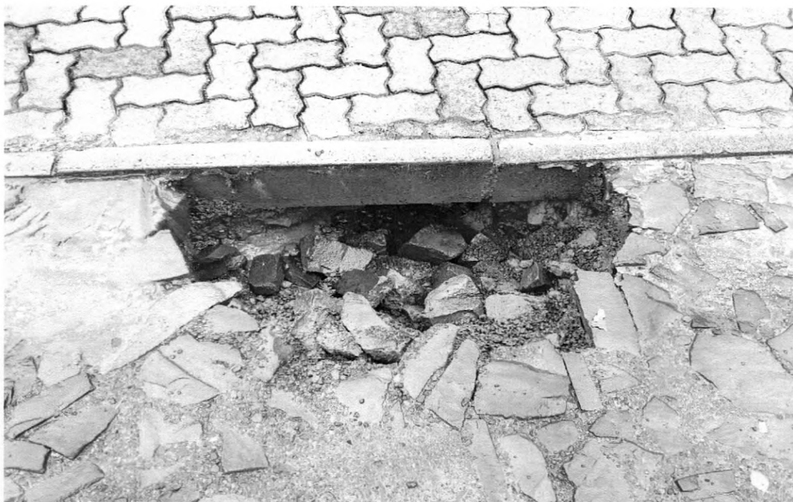
Rua Otocar Zietlow, 63 – B. São João.