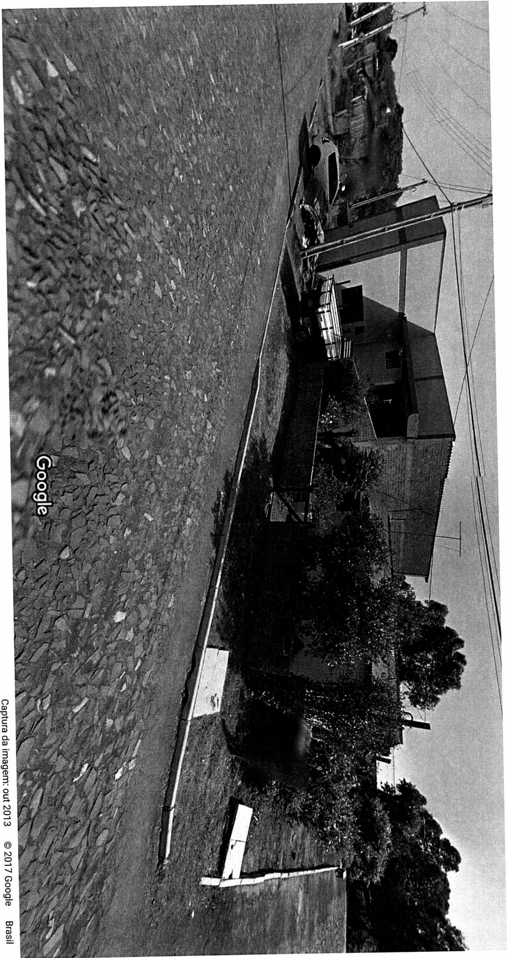
Street View - out 2013

Captura da imagem: out 2013