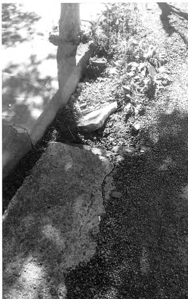
Rua Antônio Marques, entre Dr. Schmidt e Monteiro Lobato, no B. Rui Barbosa.