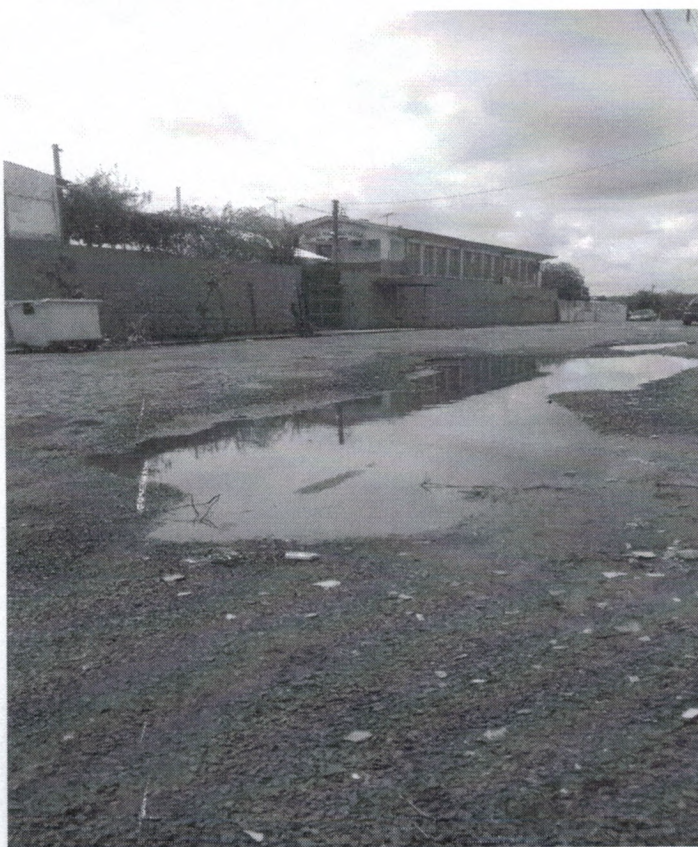
Rua Jacob Franzen, em frente ao nº 90 – B. Timbaúva