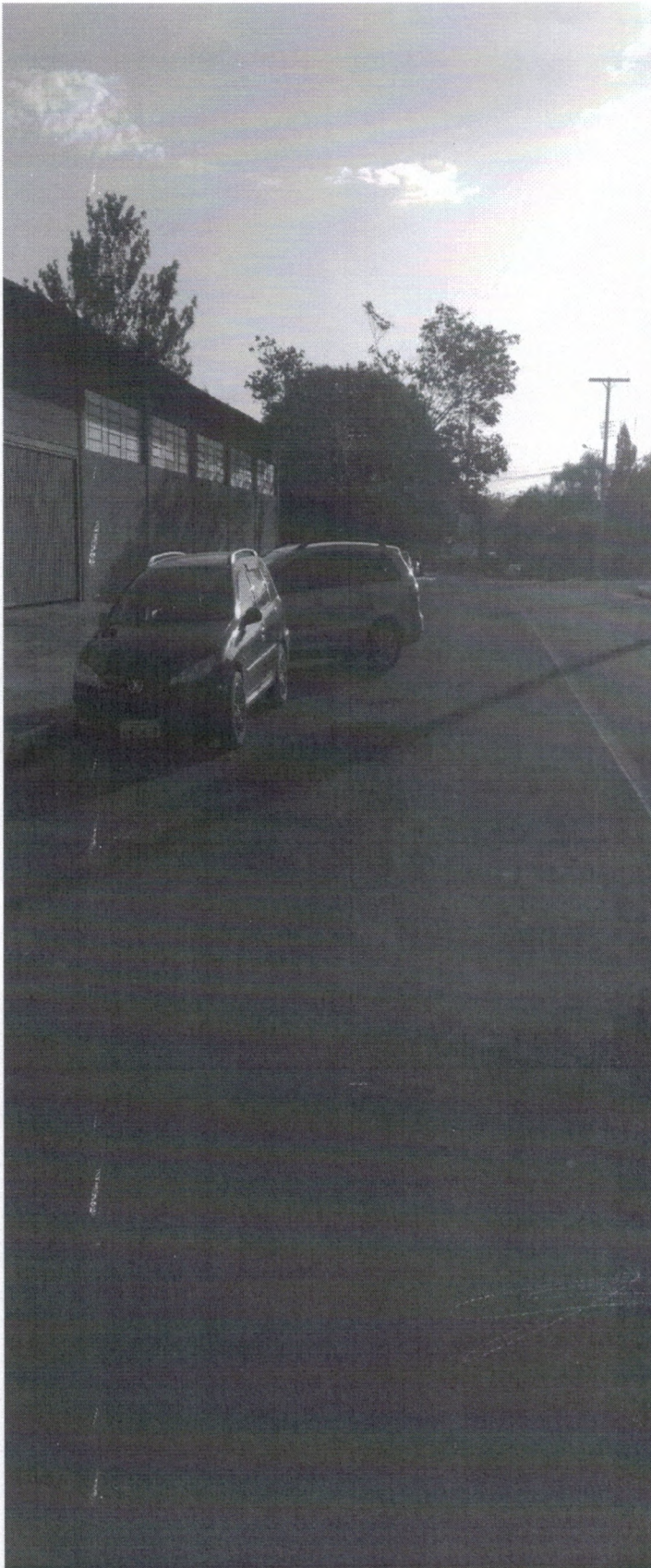
Estacionamento Oblíquo na Rua José Carlos de Oliveira, Templo e Pavilhão da Paróquia Sagrado Coração de Jesus – Timbaúva.