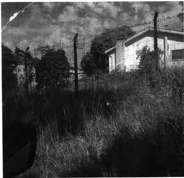
PP Limpeza e roçada Área Verde do Loteamento Resid. Área Verde- Centro.