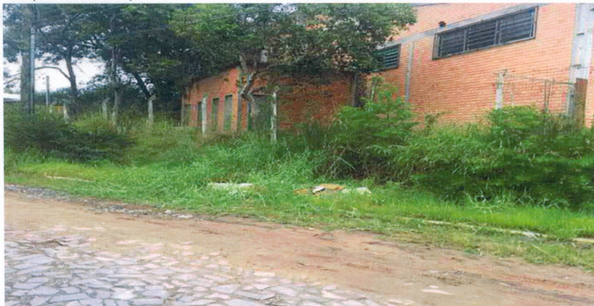
PP Limpeza e conservação da Rua Licinio Faustino Da Silva – B. Senai.