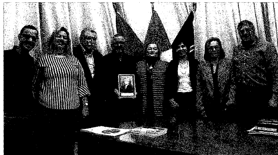
A DIVULGAÇÃO dos nomes da patrona e da homenageada da 16ª Feira do Livro ocorreu no gabinete do Prefeito