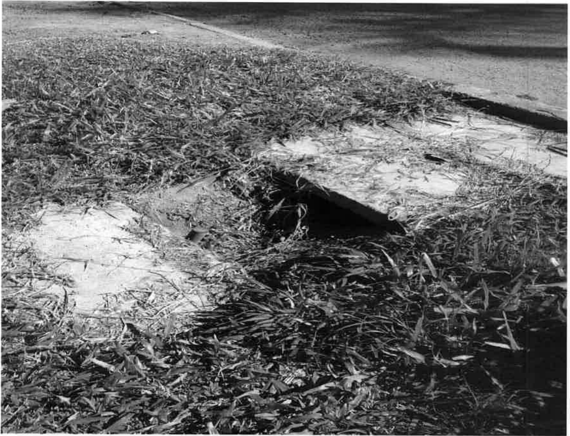
PP Conserto tampa de rede de esgoto na Av. Ernesto Popp, 885.