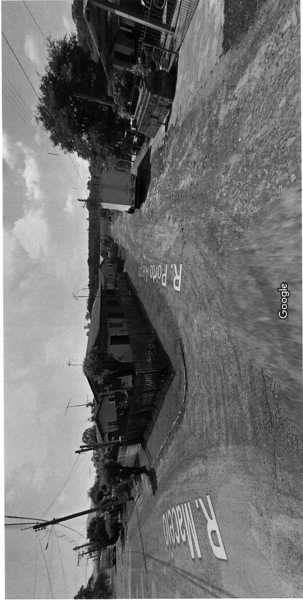
Captura da imagem: out 2011 © 2018 Google