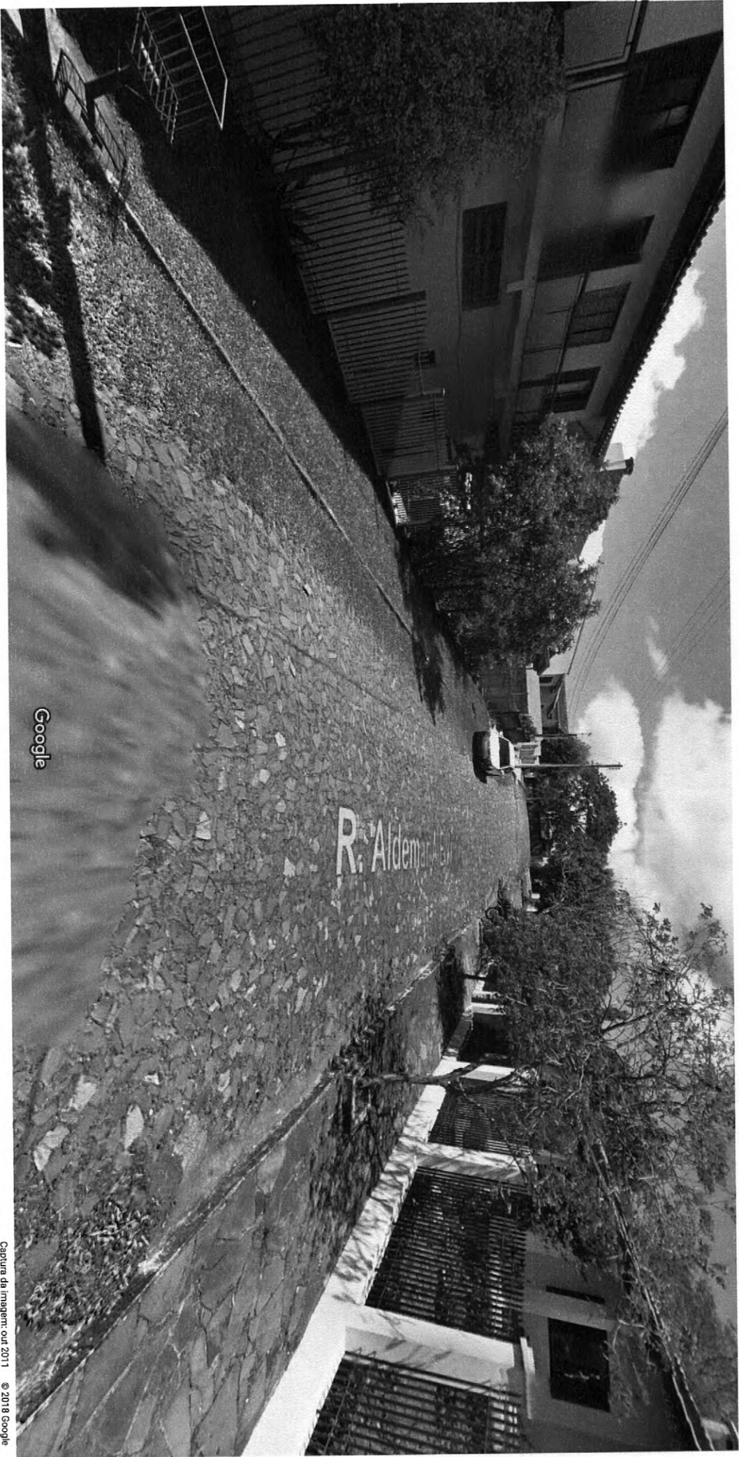
Captura da imagem: out. 2011 © 2018 Google

Montenegro, Rio Grande do Sul Google, Inc.