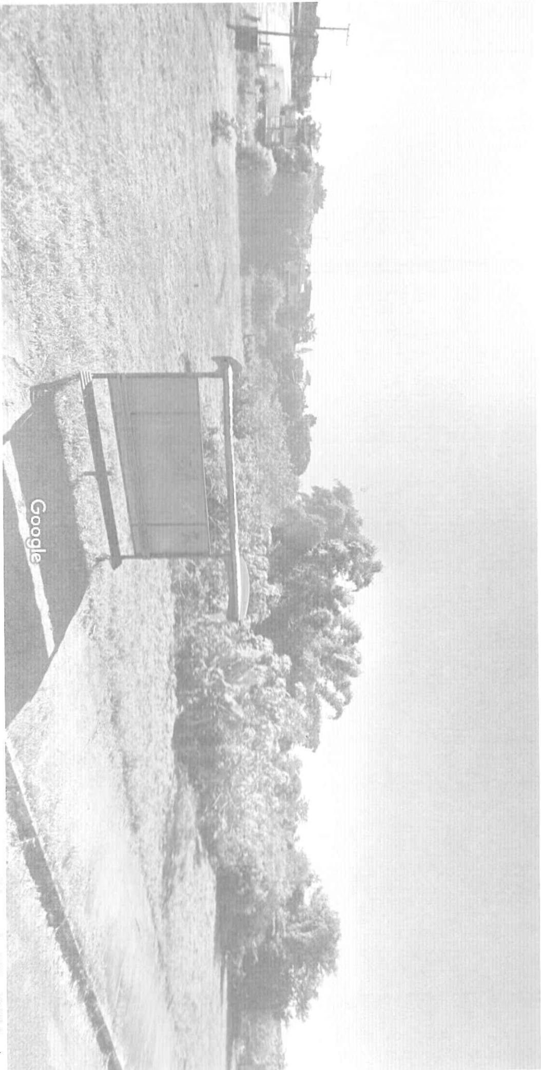
Captura da imagem: fev. 2019 © 2021 Google